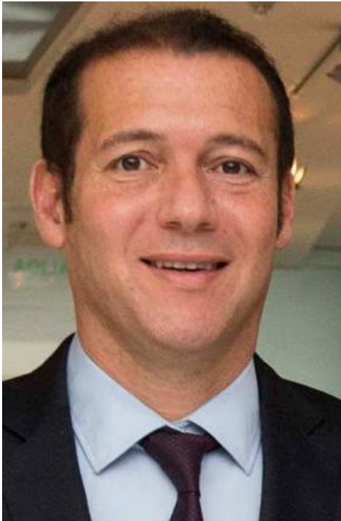
Gobernador actual: Omar Gutiérrez (Movimiento Popular Neuquino)