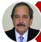
Ricardo Alfonsín Unión Cívica Radical

✓ Se impuso en grandes distritos esquivos, como Capital Federal, Santa Fe, Córdoba y Mendoza; recuperando el terreno perdido en las localidades agropecuarias