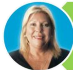
Elisa Carrió Coalición Cívica