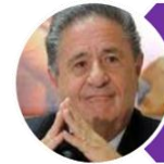
Eduardo Duhalde Unión Popular

✓ La estructura partidaria de la UCR mostró fisuras al perder ampliamente en los principales distritos del país