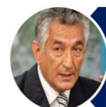
Alberto Rodríguez Saá Peronismo Federal

✓ Sin embargo, su candidata bonaerense, Margarita Stolbizer realizó una mala elección en Buenos Aires, no alcanzando el piso del 10% que esperaba