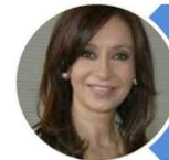
Cristina Fernández de Kirchner Frente para la Victoria