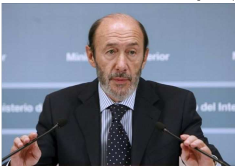
Alfredo Pérez Rubalcaba

La actual legislatura, que comenzó en 2008 en los albores de la crisis económica mundial, ha sufrido serios vaivenes, que han colocado al Ejecutivo de Zapatero en situaciones comprometidas. La más importante se produce el 10 de mayo de año pasado, cuando el presidente comparece en el Congreso de los Diputados para anunciar un drástico plan de recorte presupuestario. Ese mismo día se produce la primera gran desconexión del PSOE con su base electoral, que observa cómo se permuta la imagen de un Zapatero “protector del Estado del Bienestar” por la de un “Zapatero dependiente de los mercados y responsable del tijejetazo social”.